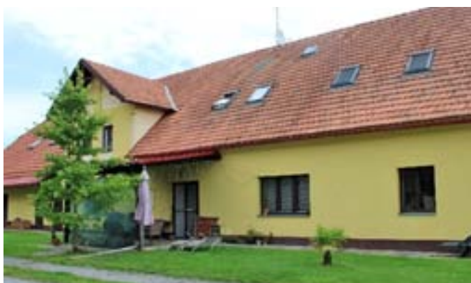
Příběh 9 – Dům čp.1 v Zádolí