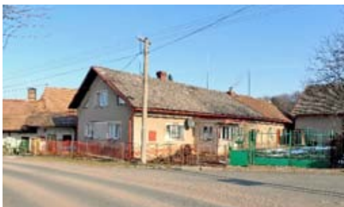
Příběh 5 – Dům čp. 100