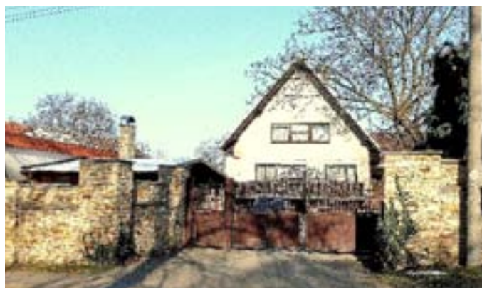
Příběh 8 – Dům čp. 80