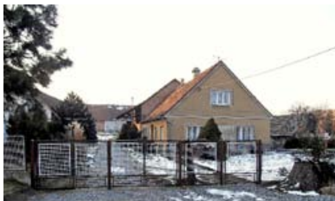
Příběh 6 – Dům čp. 29