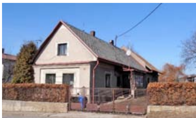
Příběh 10 – Dům čp. 87