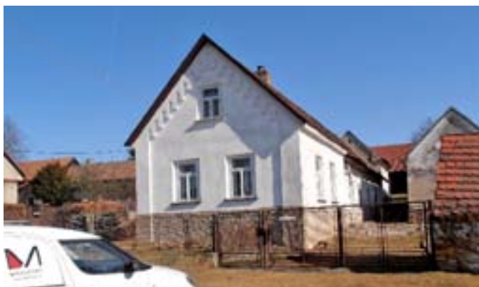
Příběh 7 – Dům čp. 91