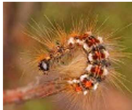
Bekyně mniška - housenka