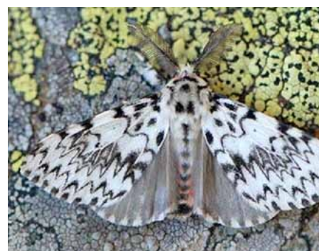
Bekyně mniška - motýl