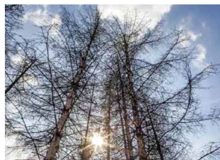
Les zdecimovaný kůrovcem