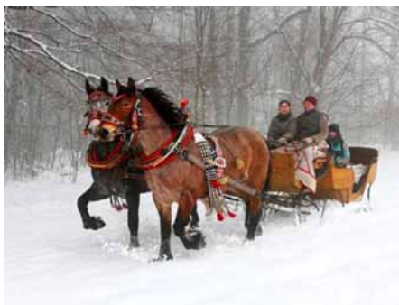
Saně za koně

Pro upřesnění uvedené hodnoty uvádím ještě poznámku z Wikipedie. (Po r. 1858 zavedena byla u nás v peněžnictví desítková soustava. Na základě jejím má Rakousko v letech 1858–1892 základní jednotku mincovní 1 zlatý (zlatka), který měl 100 krejcarů (rak. čísla). Na zlatky a krejcare se u nás mezi lidem, zvláště na venkově, počítalo ještě dlouho poté, když zavedeny byly jako platidlo koruny a haléře. Názvy zlatka a krejcar vymizela až s první světovou válkou.)