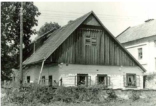
Jedním z těchto oken vletěla do místnosti smrtící střela, která ukončila život Tomáše Plichty.

Je pátek, 24. února 1797. Světélka, objevující se v přepyšských roubenkách oznamují, že se blíží večer. V chalupě č. 42 hospodaří Tomáš Plichta. V červenci mu bude 55 let, a i když to je na tehdejší dobu docela pokročilý věk, na pár kusů dobytka, trochu polnosti a domácnost zatím stačí. Žije zde sám. Do setmělé místnosti přinesl ze dvora pár polínek a položil je k peci. Je půl sedmé večer a temná místnost žádá trochu světla. Z přihrádky u pece vybere proschlou louč, založí ji do kovového svícnu a zapálí. V klidu stojí, čeká, až se blikající světlo ustálí. Hluk výstřelu a řinčící sklo okenní tabulky ani nevnímá. Umírá krátce poté, co kulka z ručnice prochází pod třetím žebrem a zasáhne srdce.