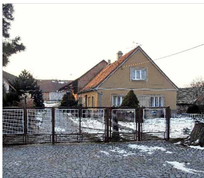
Dnešní podoba čp. 29