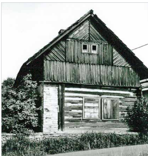
Ze sbírky kronikáře Zdeňka Bahníka

kop. Vdova po Jiřím Venclovi Ludmila se vdala za Havla Šlaňka a od nich koupil živnost v roce 1605 Jakub Turek, za 15 kop. Dále v r. 1615 – Jan Chalupník za 15 kop; 1622 – Jan Křištof za 15 kop míšenských; 1627 – Jakub Boukal za 15 kop; 1629 – Jan Matějček za 15 kop; 1630 – Jiří Beneš za 15 kop; 1671 – Jiří Havelka od Anny Vávrovny, vdovy neb dcery po Jiřím Benešovi za 30 kop; Jiří Havelka vyměnil si roli Za horou (Záhornice) a vystavil tam chalupu č. 11; 1690 – Matěj Vondra za 15 kop; 1692 – Samuel Kubíček za 19 kop;