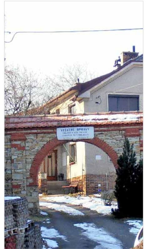
Dnešní podoba čp. 12