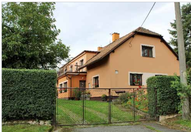
Dnešní podoba čp. 114

Začali jsme stopami Josefa Korejze Blatinského, který v šedesátých letech minulého století zachytil mizející čas, tvořící se podobu naší obce. Pro nás starší se to nezdá tak dávno, ale jeho skici jsou dokladem, jak rychle se svět mění.