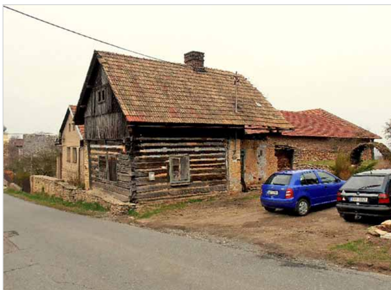
Dnešní podoba čp. 89