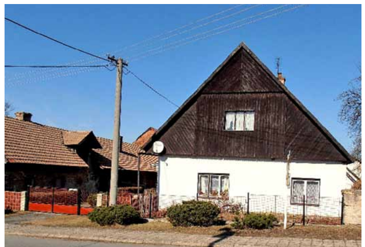
Dnešní podoba čp. 85