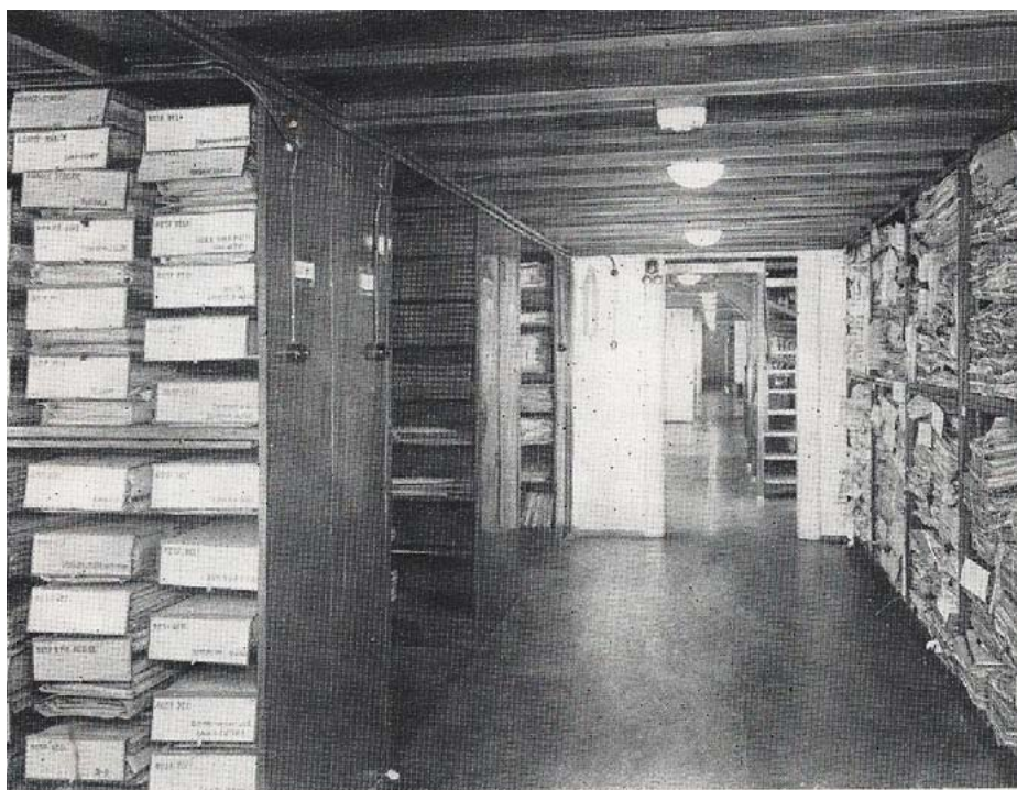
Pohled do archivu bývalého ministerstva zahraničních věcí.