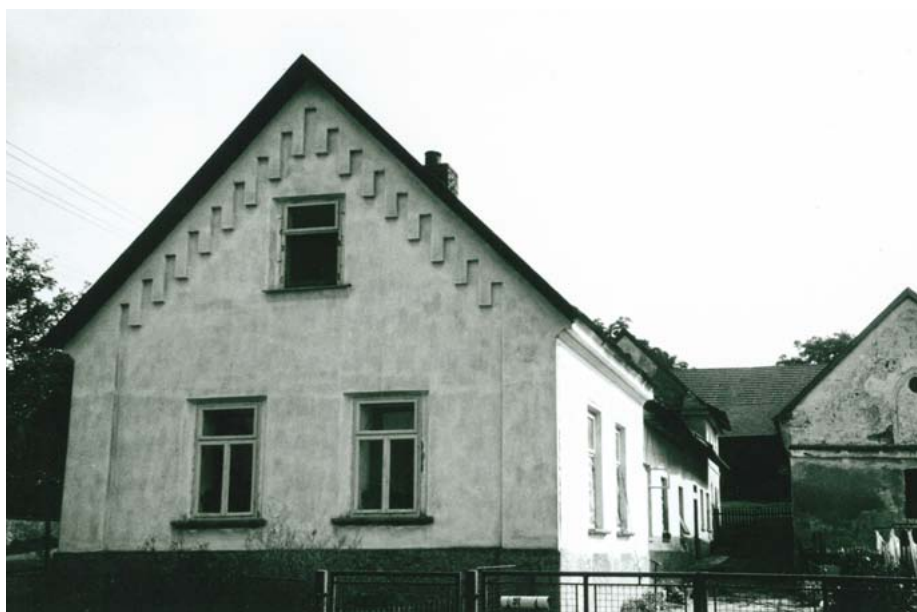
Dům čp. 91 (později Červinkovo a Kašparovo)

Myslím, že pro zarámování příběhu do místopisu obce neuškodí, když začnu, tak říkajíc, od píky. A řeknu, že hned na začátku ten rodokmen trochu zkomplikuji.