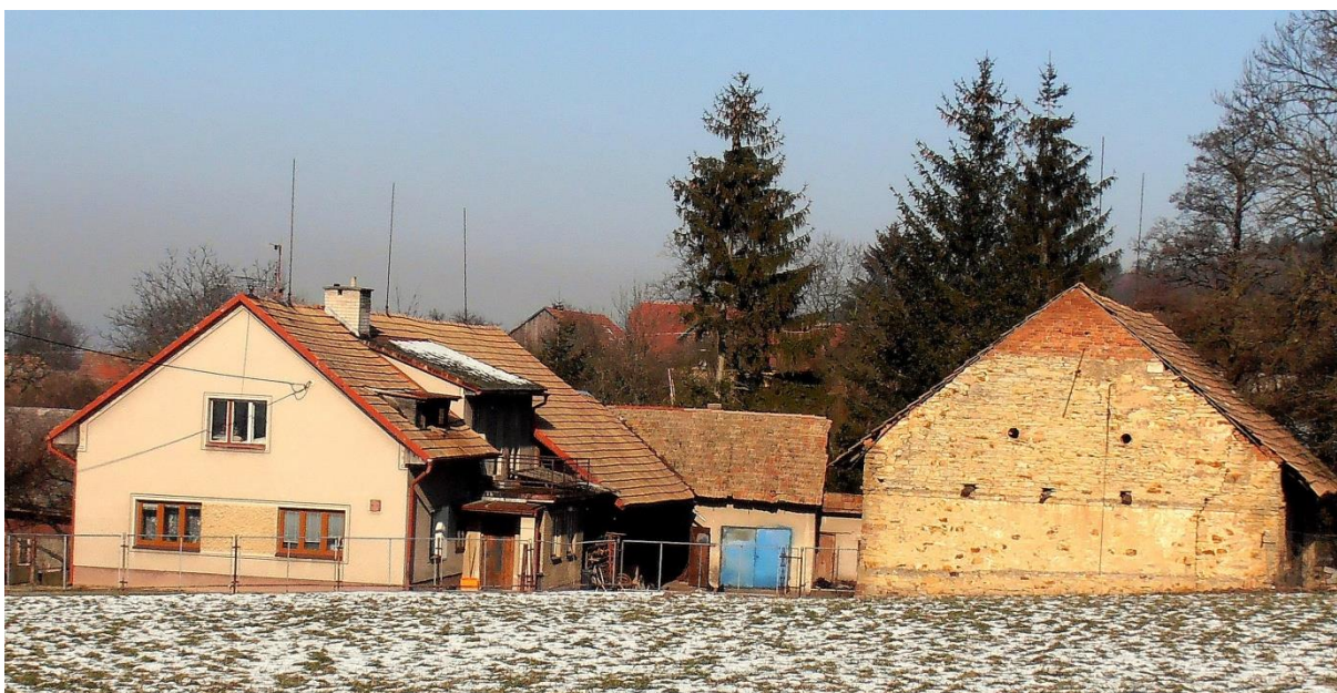
Dům čp. 124 se vzpomínanou stodolou