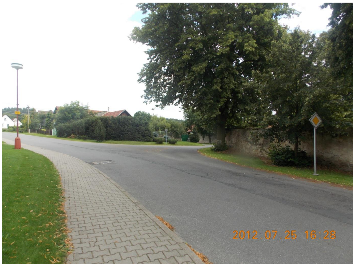
Ohyb silnice u kostela