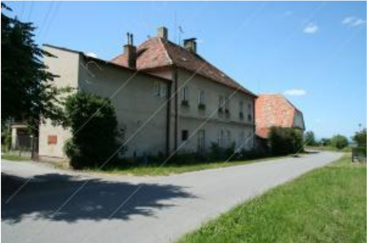
Hlavní budova Dvora podél komunikace k Mokrému