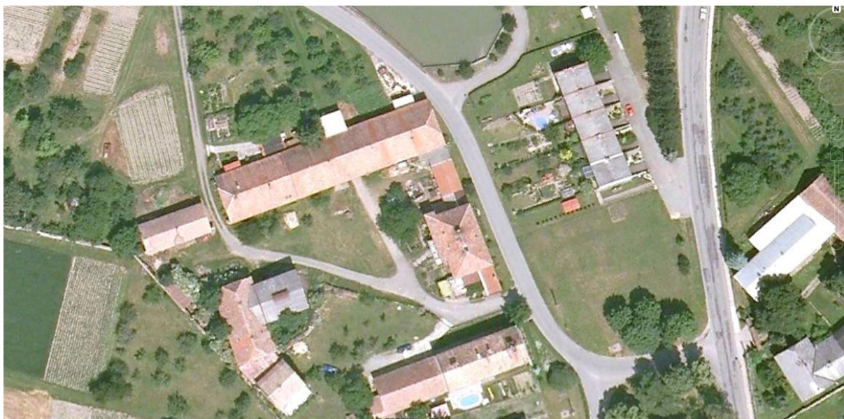
Satelitní snímek „přepyšského Dvora“

Pokud si na stránkách Google Earth v internetu zadáte souřadnice 50^{\circ}14'26.10''S a 16^{\circ}06'16.7''V , objeví se vám na monitoru obrazovky následující snímek: