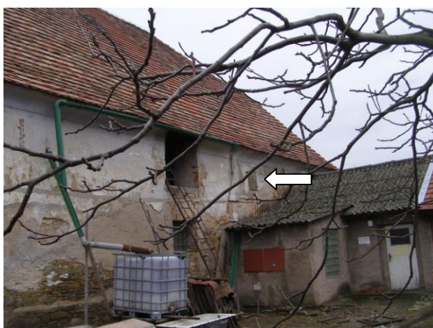
Současné umístění erbu Vlkanovských