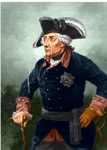
Pruský král Fridrich II.

Tuto část by bylo možné nazvat z hlediska historie Přepych také titulkem „ Generál Laudon jede skrz vesnici “. Naše ves i její bezprostřední okolí byly svědkem snad největší válečné události v tehdejších dosavadních dějinách Přepych. Pohybovalo se zde, řečeno dobovou mluvou, mnoho „potentátů“ – pruský král Bedřich II, vrchní velitel císařské rakouské armády polní maršál Leopold Josef Maria Daun a jeho velitel sboru generál-major Ernst Gideon von Laudon, jeden z nejslavnějších válečníků 18. století. Proslavil se ve válkách s Pruskem a svým tažením na Balkán proti Osmanské říši, které ho zařadilo mezi slavné turkobijce. (Jeho jméno neslo i české pivo vyráběné v Lanškrouně). Z jeho jména pochází zvolání či kletba himmellaudon! (německy: Himmel Laudon , tj. Nebesa, Laudon! ), kterou údajně volali vyděšení Prusové.