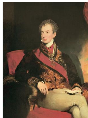
Klemens Wenzel von Metternich

královéhradeckého kraje sešlého provodilo. Odjel poté exercírce pruský král do Kosmonos k císaři rakouskému Františku a já viděl jsem s mnohým duchovenstvem tyto mocnáře na polích pulických... Dne 23. června odjel z Opočna císař ruský Alexander se svým dvořanstvem. Čtyři regimenty našeho císařského vojska mu paráděovaly a doprovázely jej skrz Dobrušku na oběd v Ratibořicích, kdež ho osvěcená kněžna Kateřina Frederika Vilemína, rozená princezna z Kurlandu očekávala.“