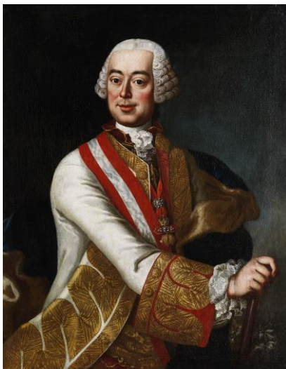
Maršál Leopold Daun