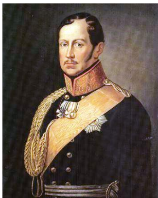
Fridrich Vilém III.

se sešlo odpoledne toho dne v polích dvora knížecího Pulického a tam své zkoušky v přítomnosti císaře ruského, krále pruského a mnoha generálů, přítomných mnoha tisíc lidí nejenom panství opočenského, nýbrž říkáje z celého