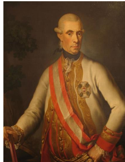
Gideon Ernst von Laudon