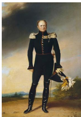
ruský car Alexandr I.