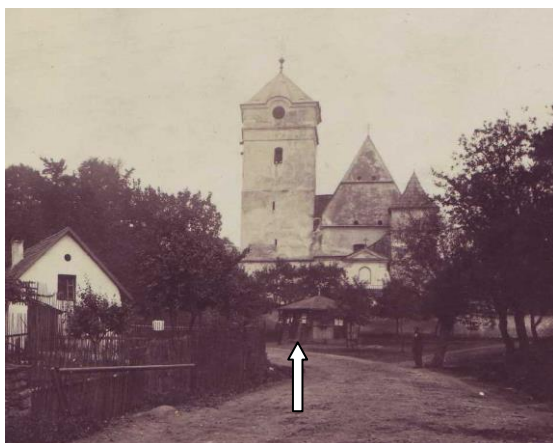
Dobové fotografie z roku 1927.....