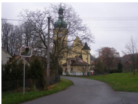
.....a pohled současný