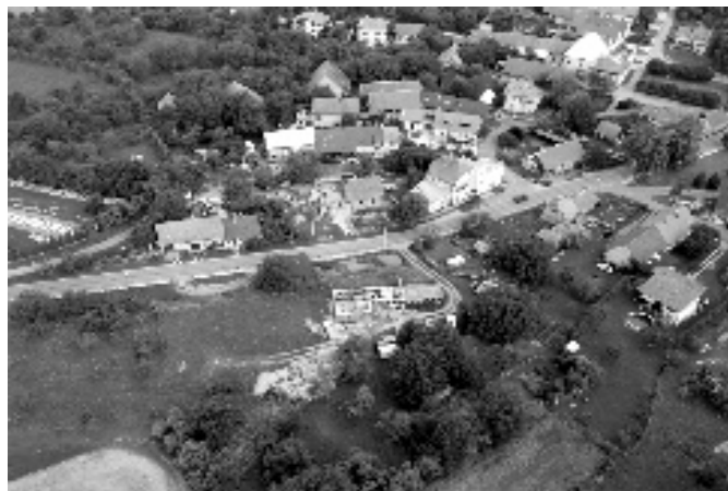
Otázka pro naše čtenáře. Kdo staví domek v Přepychách?